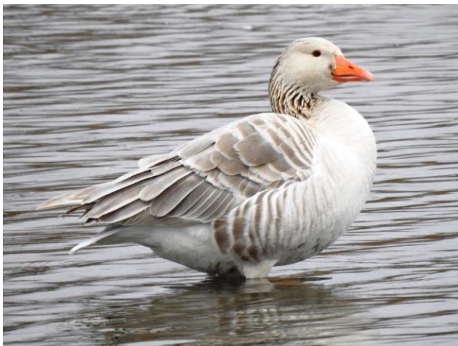
Graugans, Weissling, 26.01.20

Ein Paar Graugänse ist im Februar und März öfters im Bereich der Inseln zu sehen; es besteht damit wieder Brutverdacht. Bisher wurde allerdings nie eine Familie beobachtet. Paarweise notiert wurden an einigen Daten auch Rostgans und Nilgans. Für letztere besteht Mitte März Brutverdacht im Raum HSR – Kinderzoo.