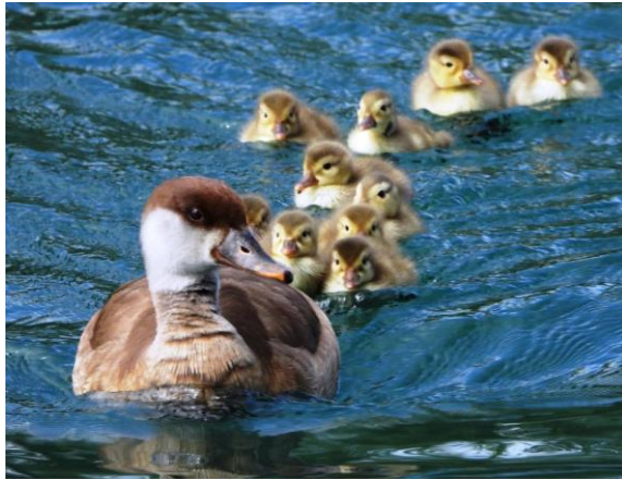
vor Ufermauer bei HSR 08.06.20