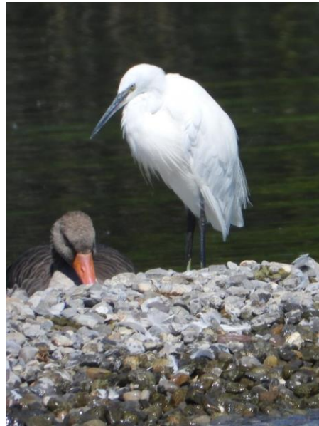
7. August mit Graugans (1 von 43)