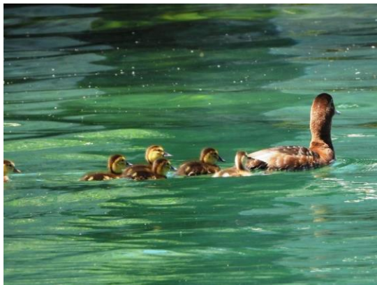
zwischen Ufer HSR und Insel 29.5.20