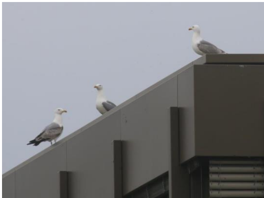
Nester jeweils an den Ecken des Daches

Auf dem Flachdach des Gebäudes links brüten Mittelmeermöwen. Vielleicht sieht man solche vom Strandweg her (1).