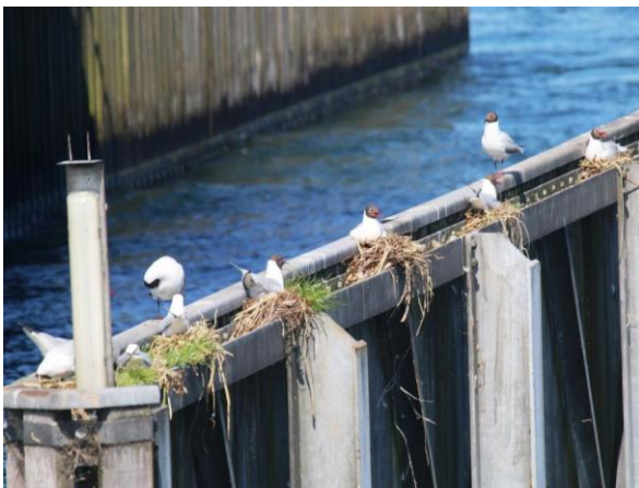
Möwen bleiben bei Schiffsdurchfahrt

Weiter zum Seedamm-Durchlass mit den «Ledigattern».