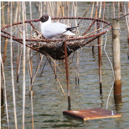
Kleinstplattform mit Schwimmbrett

Lachmöwen brüten auch am benachbarten Ufer (3), in Kleinstplattformen (Drahtkörbe auf Stützen), auf grossen Steinen und im Schilf.