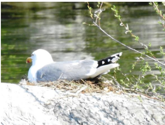
Nest mit wenigen Halmen

Ein Paar der Mittelmeermöwe hat darauf das Nest zubereitet.