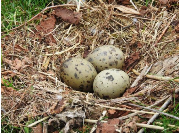
Gelege Mittelmeermöwe, meist 3 Eier

Die Mittelmeermöwe baut kein grosses Nest. Sie gräbt eine Mulde aus und verkleidet sie mit wenigen Halmen und weichem Material.