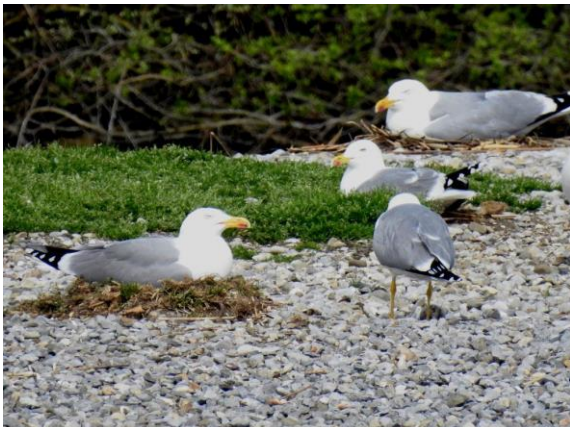
Nester oft nahe, Koloniebrüter

Die Mittelmeermöwe brütet 27 bis 31 Tage; die Jungen sind in 6 bis 8 Wochen flügge.