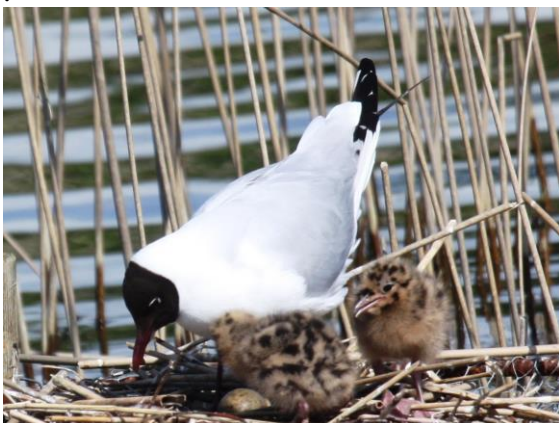
Lachmöwe mit zwei Jungen und Ei

Am früheren Standort beim Holzsteg führten Schwankungen auf dem Schwimmbrett bei den Jungmöwen zu übermässigem Energieverlust. Hier nun gelangen die Jungen auf festen Untergrund. Man sieht aber die Nester hinter dem Schilf nicht mehr oder nur wenig zwischen den Halmen des Vorjahres.