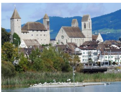
Kiesinsel mit Möwen und Störchen

Die Kiesinsel (7) wurde 2001 beim Bau des Holzsteges aufgeschüttet. In den ersten Jahren brüteten Flussee-schwalbe, Lachmöwe und die seltene Schwarzkopfmöwe. Dann eroberten die starken Mittelmeermöwen die Insel. Jedes Jahr brüten nun um die 15 Paare.