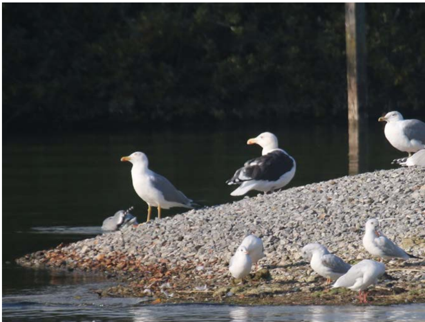
Mantelmöwe, Mittelmeer- und Lachmöwen am 17.10.16 auf der Kiesinsel.

Mantelmöwe Die Mantelmöwe wurde zu Beginn ihres Aufenthalts täglich während Stunden auf der Kiesinsel beobachtet, erschien dann aber später nur sporadisch und erst gegen Jahresende wieder vermehrt.